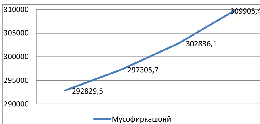
Расми 1. Динамикаи ҳамлу нақли мусофирон барои солҳои 2020 – 2023.

Динамикаи мусофиркашонӣ бо истифодаи умум дар расми 1 нишон дода шудааст: