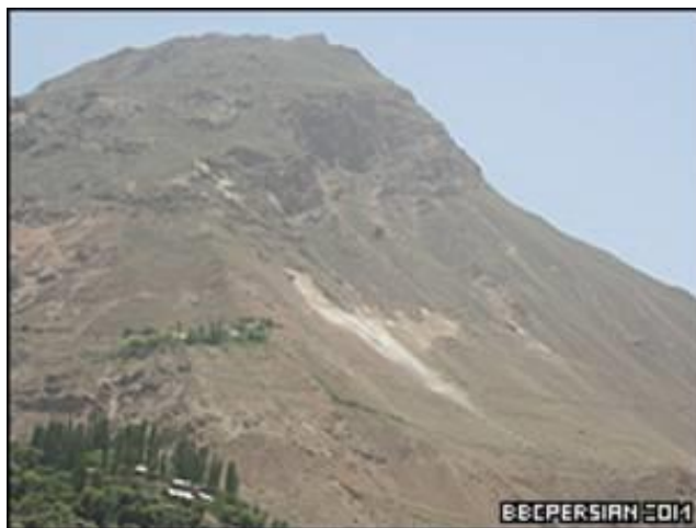
Расми 2. Деҳаи Қозиде, қони лаъл

гирифта шуда ва ин қор аз осонтарин ва муассиртарин роҳҳои истихроҷи ин маъдан арзёбӣ мешуд. Ба гуфтаи кӯҳканон, ин маъдан, ки қарнҳо қабл дар ҷаҳон шӯҳрат доштааст, барои ҳазор соли баъд низ заҳири лаъло дар худ гунҷондааст ва бо фароҳам овардани шароити беҳтар барои иқтишофи истихроҷ метавон аз ин маъдан ҳамасола то 20 килуграм лаъл ба даст овард.