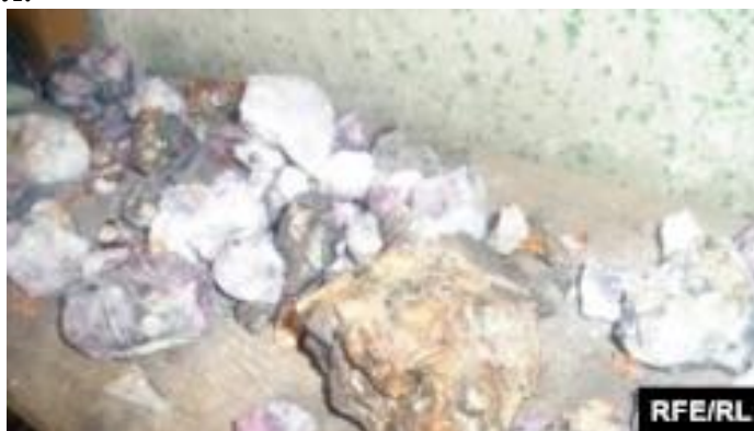
Расми 1. Намудҳои лаъл

дар захираи Осорхонаи таърихи табиӣ Амрико дар Вошингтон қарор дорад. Тавлидоти имрӯзаи Кӯҳи Лаъл.