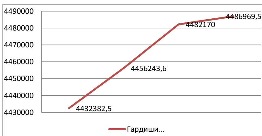
Расми 2. Динамикаи гардиши мусофирон барои солҳои 2020 – 2023.

Динамикаи гардиши мусофирон бо нақлиёти истифодаи умум дар расми 2 нишон дода шудааст [5]: